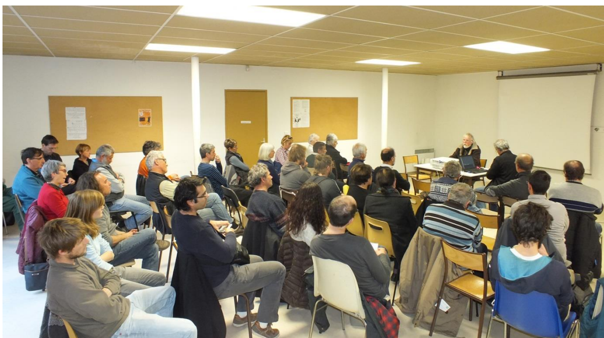
Assemblée Générale ordinaire du 8 avril 2016