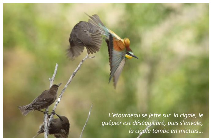
L'étourneau se jette sur la cigale, le guêpier est déséquilibré, puis s'envole, la cigale tombe en miettes...

Le guêpier s'envole avec sa proie mais dans le cas de la séquence photo, l'insecte est tombé en miettes au sol au moment de l'assaut. L'assaut a duré une seconde.