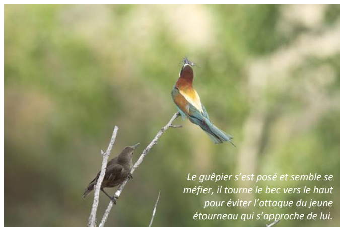
Le guêpier s'est posé et semble se méfier, il tourne le bec vers le haut pour éviter l'attaque du jeune étourneau qui s'approche de lui.

Cette matinée du 10 juillet une bande d'une bonne centaine d'étourneaux tourne dans tous les sens, entre la falaise et les arbres du bord de la rivière. La majorité sont des juvéniles. Ce jour-là, je suis témoin à plusieurs reprises du kleptoparasitisme sur des guêpiers qui régulièrement viennent se poser sur les branches de genêt près desquelles je fais un affût photo. En milieu de matinée, ils se posent sans problème la cigale dans le bec, qu'ils ne mangent pas d'ailleurs et qu'ils gardent de longues minutes avant de s'envoler une autre fois.