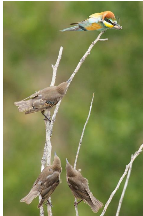
Le guêpier ne se méfie pas, il se gratte la tête. L'attaquant observe fixement le bec et la cigale, sous le regard attentif de deux complices.

Un guêpier s'installe impassible avec la cigale dans le bec, les étourneaux se rapprochent de lui, l'observent fixement et tout d'un coup, le plus intrépide et posé le plus près, fonce sur l'insecte.